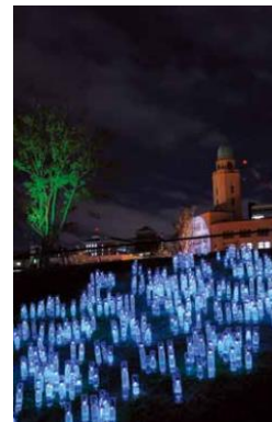
2013年最優秀賞受賞作品 Light Bottles