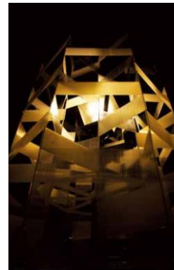
2013年最優秀賞受賞作品 TO/TO透/燈