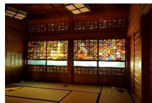
写真は昨年(2013年)の新治の様子(緑区)